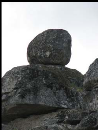
Bloco em equilíbrio

Ao caminhar pelas encostas do inselberg podemos encontrar inúmeras formas esculpidas pelos agentes erosivos e pelo tempo.