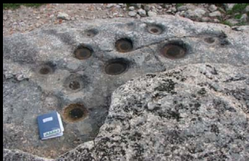
Pias ou Gnammas