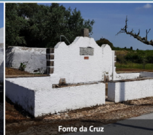
Fonte da Cruz