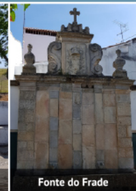
Fonte do Frade