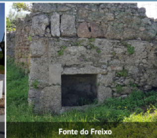
Fonte do Freixo