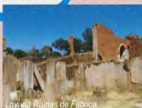
Lavaria Ruínas de Fábrica