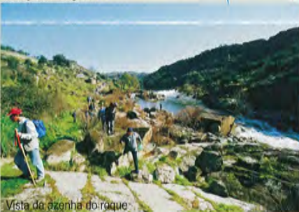
Vista da azenha do roque

Após visita regressa-se ao referido clube, continuando o percurso por um caminho que passa a sul do Campo de Futebol e depois à direita por um caminho de asfalto em direcção a Segura.