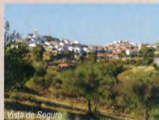
Vista de Segura