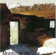
Moinho de rodízios