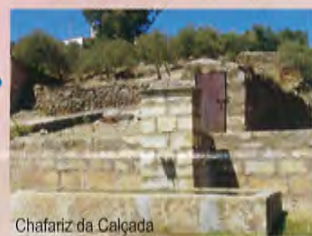
Chafariz da Calçada