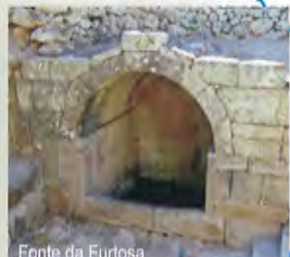
Fonte da Furtosa