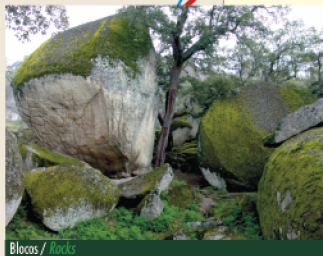
Blocos / Rocks