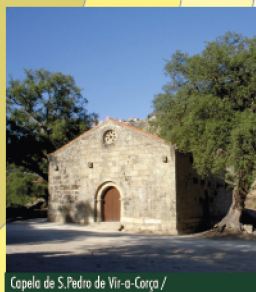
Capela de S. Pedro de Vir-a-Corça / S. Pedro de Vir-a-Corça Chapel