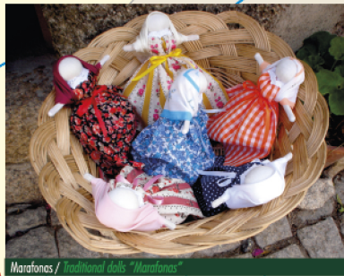
Marafonas / Traditional dolls "Marafonas"