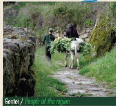
Gentes / People of the region

A partir da Rua da Sarça, experimentam-se territórios selvagens, de intensa interacção com a Natureza. É percorrido um estreito trilho que corta a meia encosta este monte-ilha no sentido do Adingeiro. Vale a pena ir até à Pedra Bolideira e experimentar mexer um bloco com centenas de toneladas equilibrado a 5 m do chão! De regresso, o trilho faz-se agora entre antigas hortas num luxuriante sobreiro secular. São intensos os derradeiros momentos que antecedem a chegada ao recinto da Capela de S. Pedro de Vir-a-Corça. Situada numa clareira defendida por colossais penedias, com perspectivas indescritíveis da vertente da montanha conquistada, esta é mais uma jóia do Românico beirão, povoada de lendas e de tradições seculares. Mas o percurso segue novamente por entre sobreiros e penedias no sentido ascendente. Um sinuoso caminho de romaria passa primeiro num estranho bloco granítico que apresenta uma alteração em polígonos bem definidos. Depois, a subida encrespa-se ziguezagueando por entre colossos de granito que ora escondem ora apresentam uma paisagem agreste de cortar a respiração. Daqui se regressa à Rua Marquês da Graciosa, à sombra da célebre Torre de Lucano, também conhecida por "torre do galo" por ser encimada por uma réplica do troféu que granjeou Monsanto com o título de "Aldeia mais Portuguesa". A derradeira direcção é agora a do Posto de Turismo, o final de uma viagem sensorial que aqui teve a sua origem.