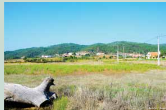
Paisagem da Aldeia da Grade

De St. Ildefonso regressamos à Ribeira que alberga na margem o velho lugar do qual restam apenas as galgas que moíam as azeitonas. Vamos encontrar o Moinho do Pereiro e o Moinho do Casal Novo onde podemos entrar e aprender como era moído o cereal. Estamos agora de volta à Grade e aos seus campos cultivados onde termina este percurso, no mesmo local de onde partimos.