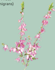
Urze Rosa (Calluna vulgaris)