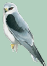
Peneireiro cinzento (Elanus caeruleus)