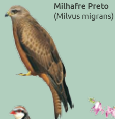
Milhafre Preto (Milvus migrans)