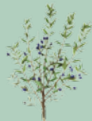
Murta (Myrtus communis)