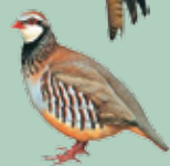
Perdiz (Alectoris rufa)