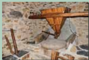
Interior do Moinho

Ao longo de todo o percurso podemos observar variadas espécies de plantas características da flora mediterrânica, entre as quais sobreiros, oliveiras, carvalhos, medronheiros, vinhas, urzes, rosmaninho e estevas, assim como pequenas plantas herbáceas que tornam a Primavera muito mais colorida e perfumada.