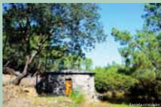
Moinho do Casal Novo