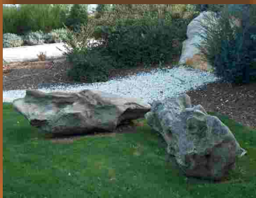
Troncos fósseis na CACTEJO

De regresso ao percurso, siga pelo passeio público que o leva de novo até ao CIART, onde se iniciou e termina esta jornada. No entanto, no jardim do Centro de Saúde poderá apreciar um painel de azulejos do