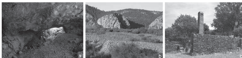
Figura 3 – Três geomonumentos do Geopark Naturtejo com interesse geomineiro: Complexo Mineiro de Monforte da Beira (a), Mina de Ouro Romana Conhal do Arneiro (b), Couto Mineiro de Segura (c)

O Couto Mineiro de Segura é um dos locais geomineiros mais importantes de todo o território do geoparque. A exploração de bário, chumbo, estanho e volfrâmio está ligada à Empresa Mineira de Segura e ao seu proprietário o Engenheiro Geólogo Bacellar Bebiano. Existem poços e galerias no seio de uma paisagem rural e também alguns vestígios de maquinaria e da lavaria-piloto (Figura 3c).