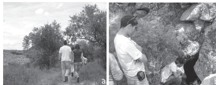
Figura 6 – Actividades educativas na Mina de Ouro do Conhal do Arneiro (a) e na Buraca da Faiopa (b)

No Geopark Naturtejo extraiu-se ouro, estanho, chumbo, bário, antimónio, volfrâmio, cobre e diversas pedras semi-preciosas que possibilitam promover