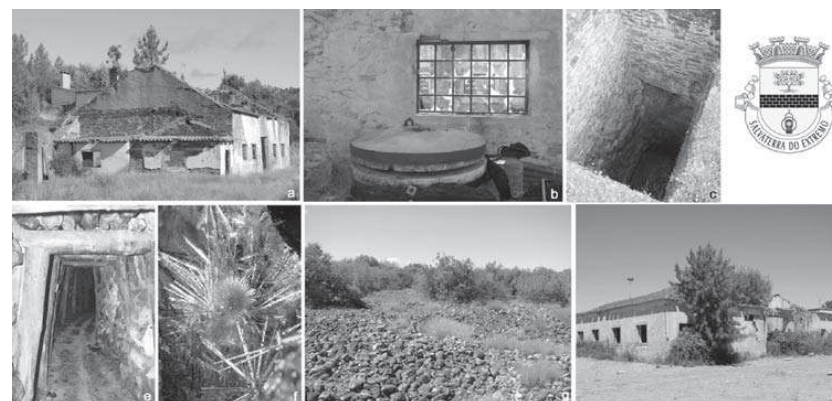
Figura 4 – Locais com interesse geomineiro: Mina das Gatas (Sarzedas) (a,b), Mina dos Currais d’Arvela (Salvaterra do Extremo), (c) heráldica da vila de Salvaterra do Extremo (d), Galeria da mina Fragas do Cavalo (e), mineral de cobre da mina de Ingadanais (f), exploração romana de ouro da Tapada do Gorroal (Salvaterra do Extremo) (g), instalações da Empresa de Estanhos da Lardosa (h)