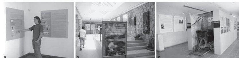
Figura 7 – Exposições: “...Vou ao minério!”, patente no Posto de Turismo de Segura (a), “From Trilobites to Man” no Geopark de Lesvos, em 2007 (b), “Quando a gente andava ao menério”, Centro Cultural Raiano, Idanha-a-Nova, 2011 (c).

A exposição itinerante “From Trilobites to Man”, inaugurada no Geopark da Floresta Petrificada de Lesvos (Grécia), em 2007, tem como objectivo a apresentação do Geopark Naturtejo, contemplando a sua paisagem e realidade mineira (Figura 7b).