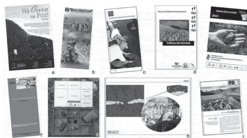
Figura 5 – Material promocional e interpretativo aplicado no Geopark Naturtejo: (a) Poster de promoção da actividade turística “Há Ouro na Foz”, existente à entrada da Aldeia de Xisto Foz do Cobreão, (b) folheto do percurso pedestre “Rota das Minas” (Segura), (c) folheto do percurso pedestre “Caminho do Xisto da Foz do Cobreão”, (d) guia geoturístico para a interpretação do percurso pedestre “Trilhos do Conhal” (Arneiro), (e) folheto da actividade de Ciência e Património (Ciência Viva no Verão) “Tempos Loucos do Volfo”, (f) folheto da actividade de Geologia no Verão “O Ouro nas Portas de Almourão”, (g) geobox com minerais e rochas representativas da Mina das Gatas (Sarzedas), (h) poster para interpretação da formação de um filão de quartzo, (i) roteiro de exploração do percurso pedestre “Rota das Conheiras” (Sobral Fernando)

Para que os utensílios e infra-estruturas mineiras não sejam vistos como meros objectos sem significado é necessário proceder à sua devida interpretação, valorizando-os. Só através de uma valorização adequada é possível sensibilizar para a importância destes bens, explorando as funções e modos de utilização.