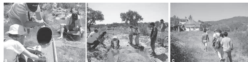
Figura 9 – Actividades geoturísticas: “Há Ouro na Foz!” (a), demonstração da técnica de garimpo de volfrâmio por um antigo mineiro (b) e visita às antigas instalações da Mina das Gatas em Sarzedas (c) na rota temática “Tempos Loucos do Volfo”

A rota temática “O Ouro das Portas de Almourão!” surge com o objectivo de combinar outras actividades já existentes como o percurso pedestre “Segredos do Vale de Almourão” que permite a interpretação da geologia regional e do contexto de aparecimento do ouro, o percurso pedestre “Rota das Conheiras” dedicado aos vestígios da exploração romana de ouro e a actividade de garimpo “Há Ouro na Foz” onde todos experimentam a técnica milenar que tem sido usada até os dias de hoje (Figura 9a). Este é um programa com a duração de um dia que permite explorar as várias dimensões do património geomineiro, designadamente da geologia, história e técnicas mineiras associadas à exploração de ouro nesta região.