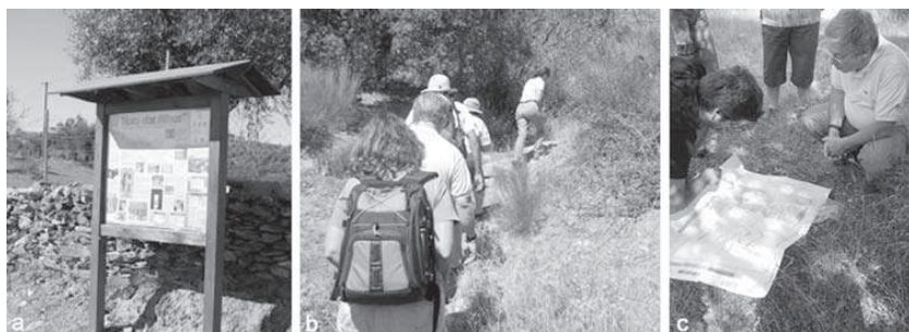
Figura 8 – Rota das Minas, de Segura: painel introdutório (a), trilho (b), interpretação do contexto geológico durante visita guiada (c)

Desde meados do séc. XIX, e durante cerca de um século, os variados recursos minerais da região de Segura foram explorados de uma forma mais ou menos sistemática, tendo sido constituído o couto mineiro de Segura, um dos mais relevantes de todo o Geopark Naturtejo. As mineralizações com interesse económico ocorrem associadas a filonetes e veios de quartzo e barite. Estes corpos intrusivos ao longo de fracturas têm uma génese em íntima relação com a presença do maciço granítico de Segura. O volfrâmio e o estanho ocorrem em