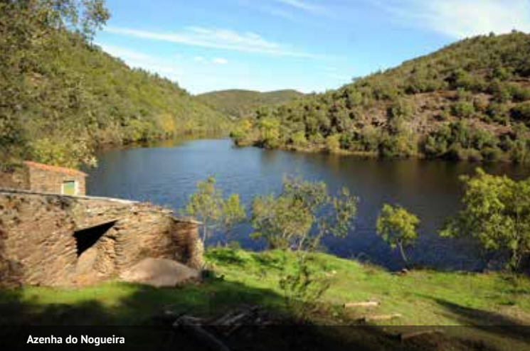
Azenha do Nogueira